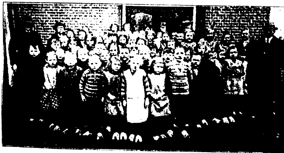
Hierboven het schiedende hoofd te midden van zijn leerlingen en enkele officiële personen, bij het afscheid tegenwoordig.