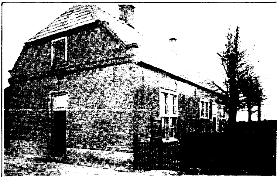
De Ole Sloeze.

De naam vertelt ons, dat daar vroeger een sluis is geweest, welke ouder was dan de sluis,