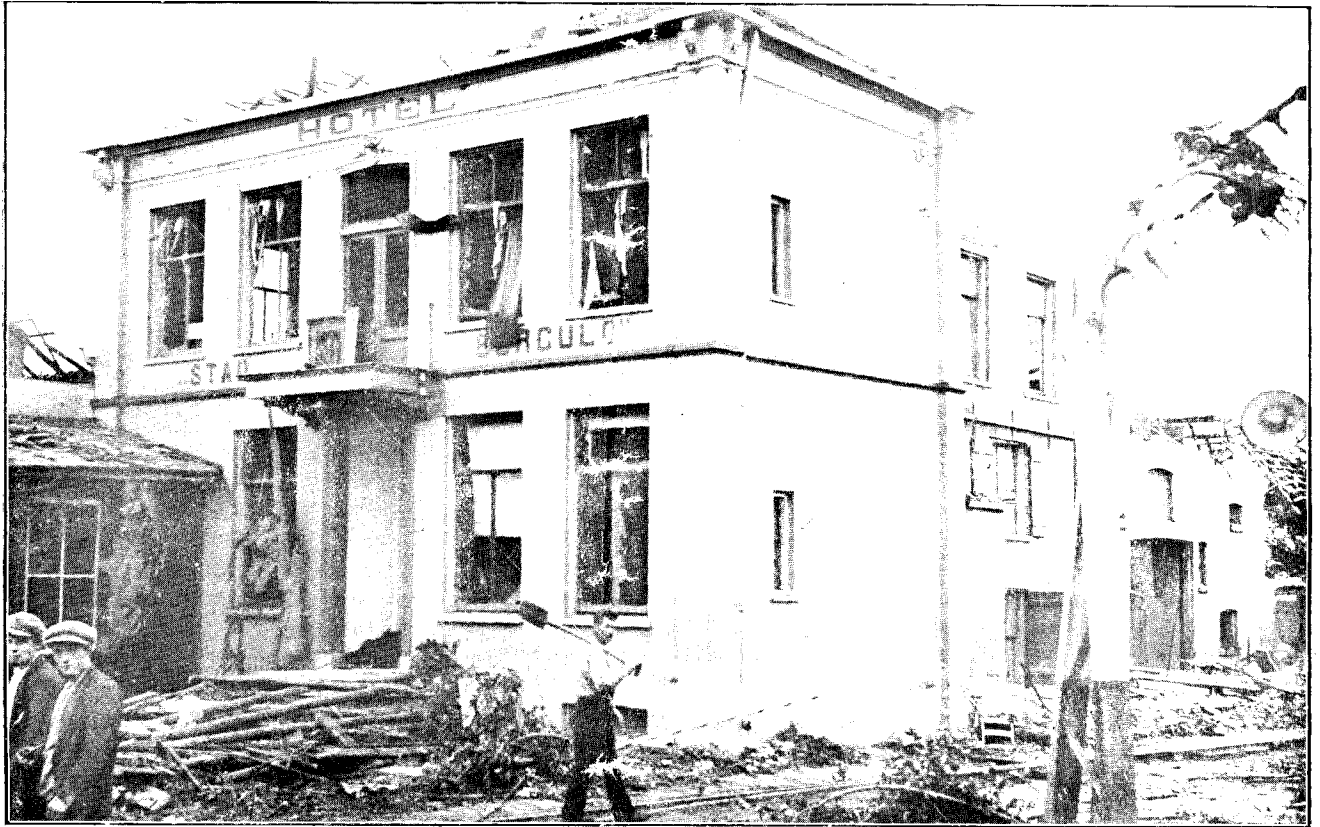
Het hôtel Wyers te Borculo scheen aan de voorzijde nu niet zoo héél erg beschadigd te zijn...